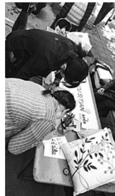
⊕ Удружење „Сачувајмо Цетињску и Зетску улицу“ са јастуцима, симболима борбе против ноћне буке