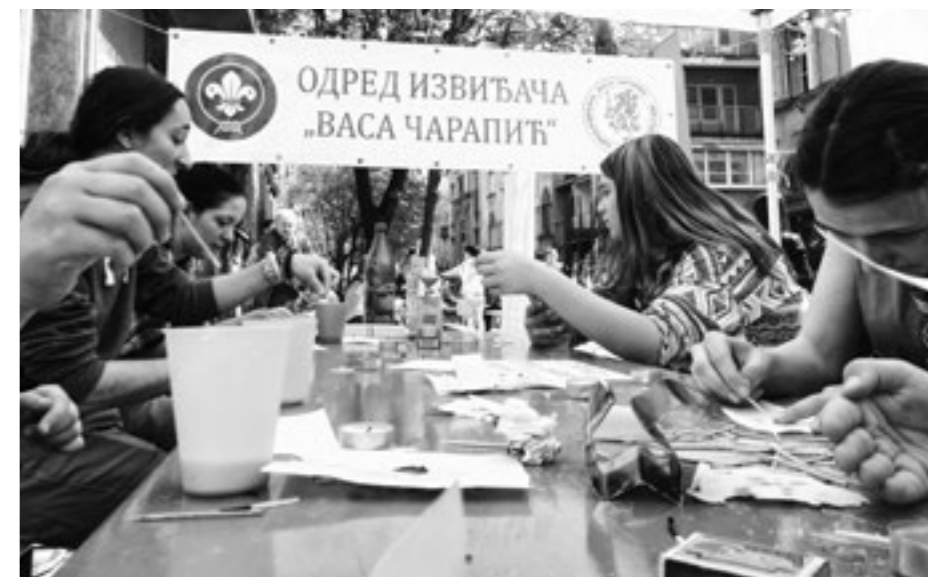
⊕ Млади извиђачи подучавају посетиоце својим вештинама