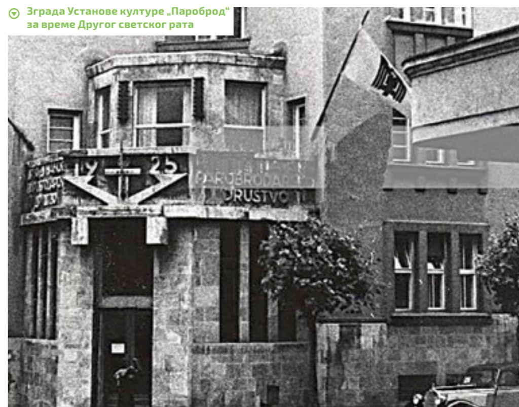
Ⓞ Зграда Установе културе „Пароброд“ за време Другог светског рата

Доситејево првобитно саграђена 1902. године да би наследници породице на истом месту 1936. подигли складну вишеспратницу у духу модерне, кућа на углу Јевремове и Француске у којој је живео Никола Пашић, угаона