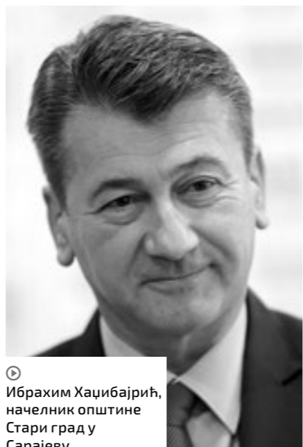
Ибрахим Хаџибајрић, начелник општине Стари град у Сарајеву