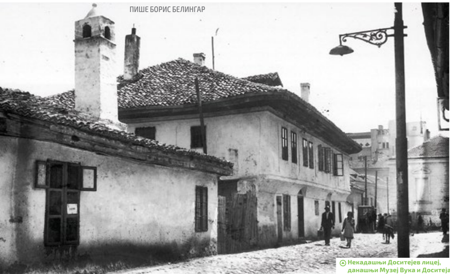
ПИШЕ БОРИС БЕЛИНГАР