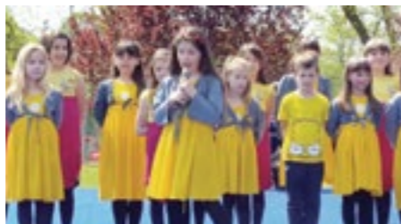
Препознатљиве жуте мајчице хора „Колибри“