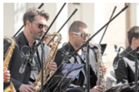
За џез свирку испред „Пароброда“ задужен је Биг бенд

Са „Мокрањчеве бине“ на углу Јевремове и Доситејеве улице, одјекују звуци младости Старог града, јер школски бендови основних и средњих школа са наше општине показују своју страст према музици. ☺ РСГ