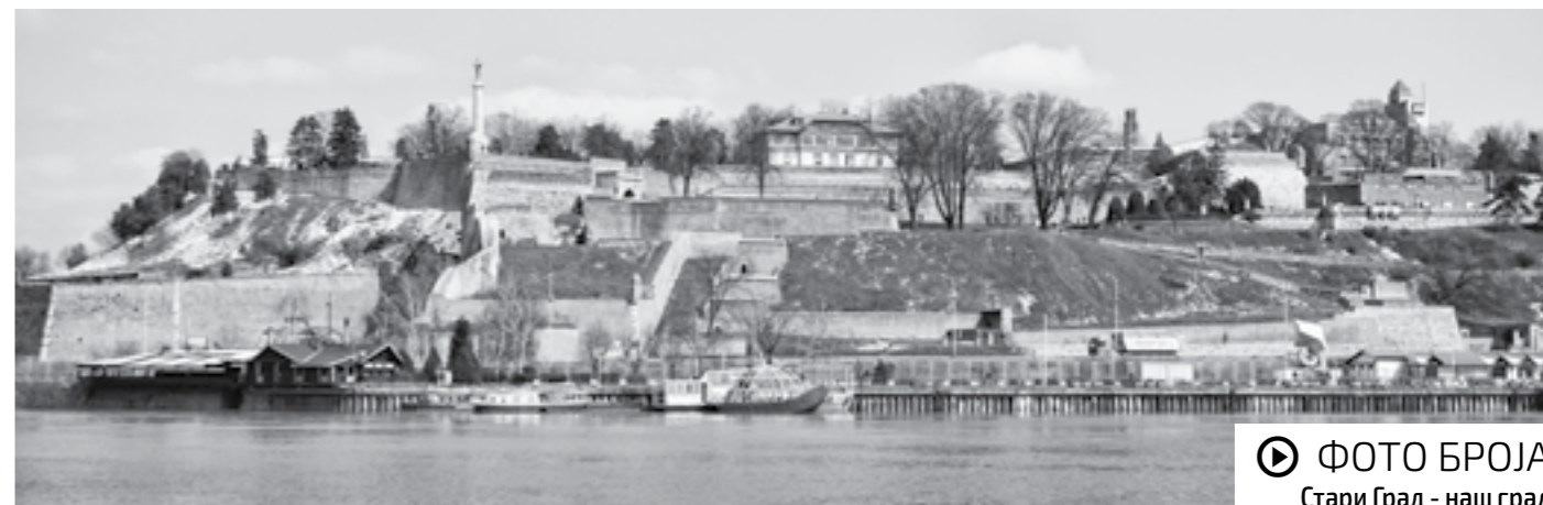
ФОТО БРОЈА Стари Град - наш град

Ти си мој град. Ти си Стари град. А Стари град је наш град. Зато срећан нам свима диван дан. И хвала вам што чувате Стари град. ☺