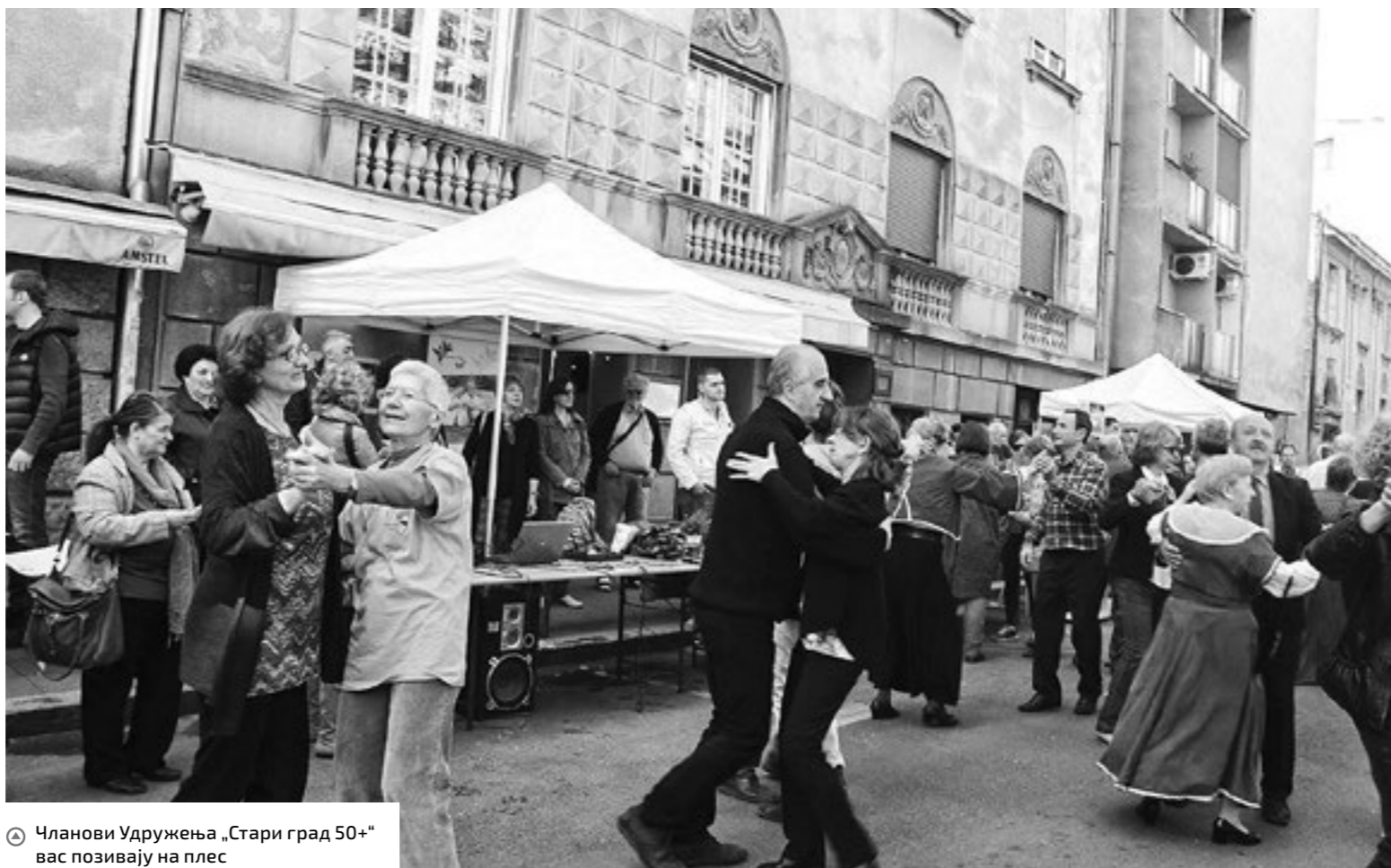
⊕ Чланови Удружења „Стари град 50+“ вас позивају на плес