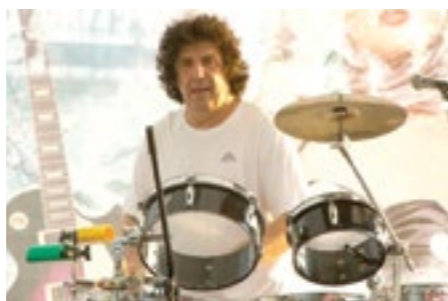
Чувени бубњар Драгољуб Ђуричић

Прослава се наставља наступом „Интермецо квартета“, женског гудачког састава који од '99. заузима место лидера у извођењу рок обрада смелим и иновативним аранжманима препознатљивих нумера омиљених страних, а све чешће и домаћих бендова. Жанровска разуђеност, љубав према нечему што није само класична музика као и потреба да се та и таква музика изводи на класичним инструментима, чини „Интермецо квартет“ различитим од других састава сличног типа. Репертоар по коме су познате широј публици