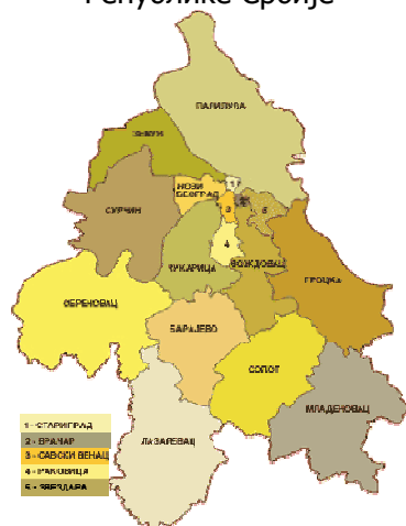
Карта београдских општина

Име Старог града одражава историјско место и улогу старог градског средишта одакле се Београд даље развијао. Садашња општина је настала и понела данашњи назив 1957, а